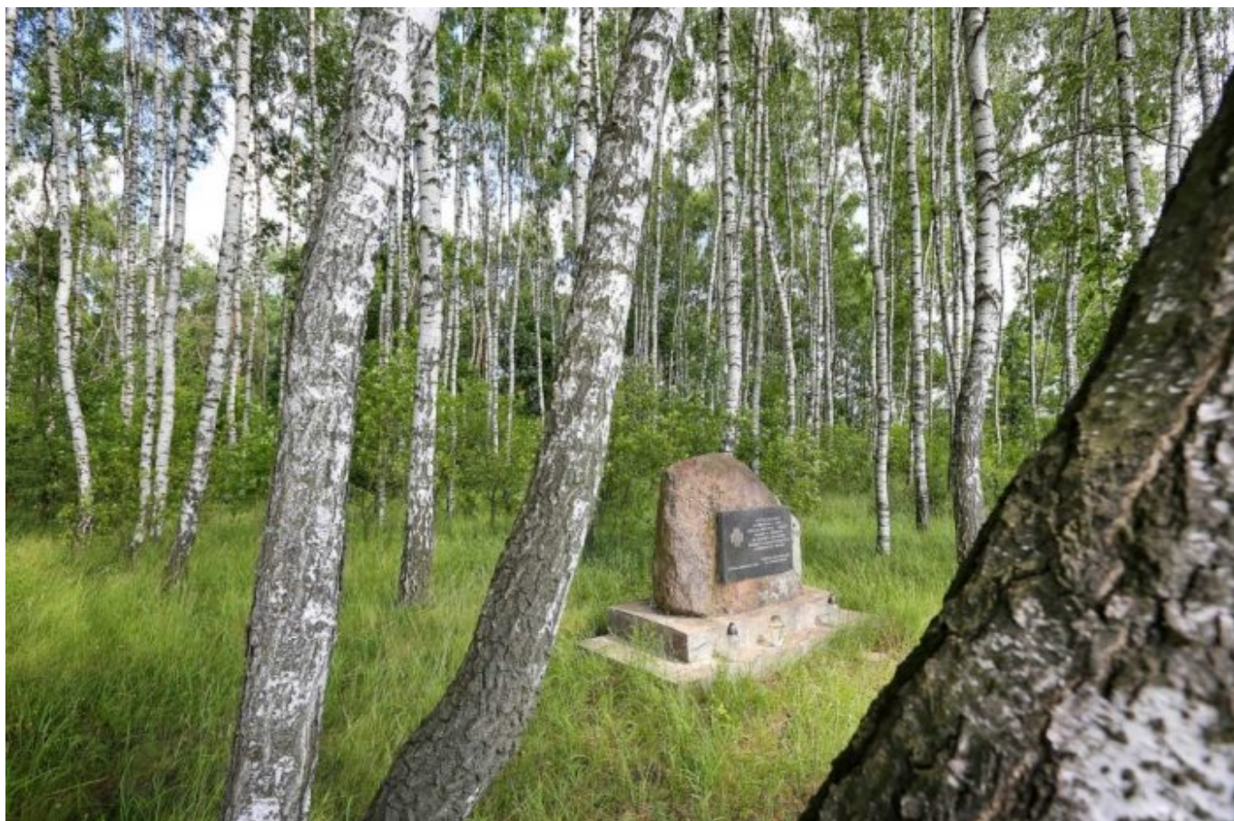
Wólka Konopna. Pomnik ku czci partyzantów z WiN.