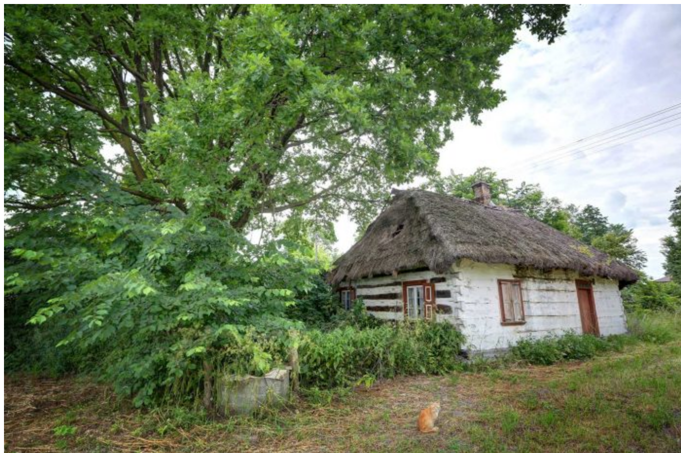
Kurów. Chata chłopska z początku XIX w.

W Trzebieszowie była stacja królewska, tzn. obowiązek goszczenia panującego z dworem, a także jego urzędników i wysłanników. Obowiązek ten utrzymał się w Polsce (po części zamienny na określone świadczenia pieniężne) w dobrach królewskich i klasztornych aż do czasów nowożytnych. Przodkowie wsi Trzebieszów, to potomkowie szlachty zagrodowej, którą cechowało przywiązanie do tradycji i kultury chrześcijańskiej.